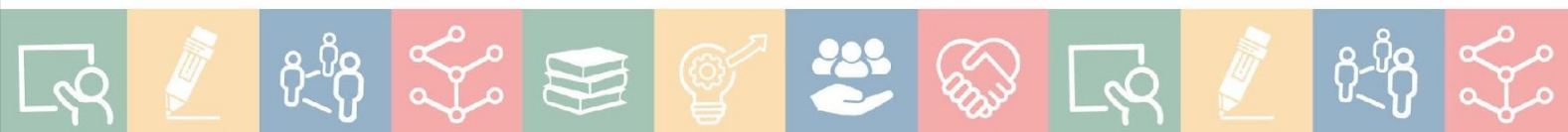
Figura 1: Dificuldades nas aulas de ciências

É um desafio conseguir promover esse processo dentro das escolas, observa-se que está além do alcance somente dos professores ou da instituição de ensino, passa por muitas outras áreas como as políticas escolares, os sistemas de ensino, e a concepção de ciências, que acarretam em dificuldades para o aprendizado dos estudantes. Quando questionados acerca das dificuldades nesse processo, evidencia-se a partir do contexto do Ensino Médio noturno no qual estagiamos, que não era somente uma suspeita, conforme se observa no gráfico da Figura 1: