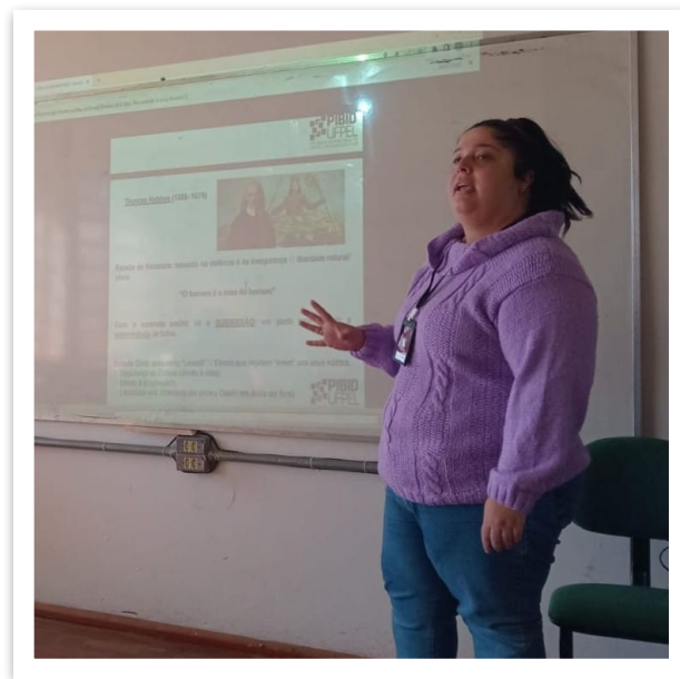
Foto 01: Aplicação da aula teórica; exposição das teorias dos Contratualistas (16.jun.25).

A análise dos resultados baseou-se na observação participante, considerando aspectos como o nível de engajamento dos estudantes, a participação nas atividades propostas e a capacidade de relacionar os conceitos teóricos discutidos com situações da vida social. A partir dessas observações, foi possível refletir sobre as contribuições da prática pedagógica para o ensino de Sociologia no Ensino Médio e para o desenvolvimento do pensamento crítico dos alunos.