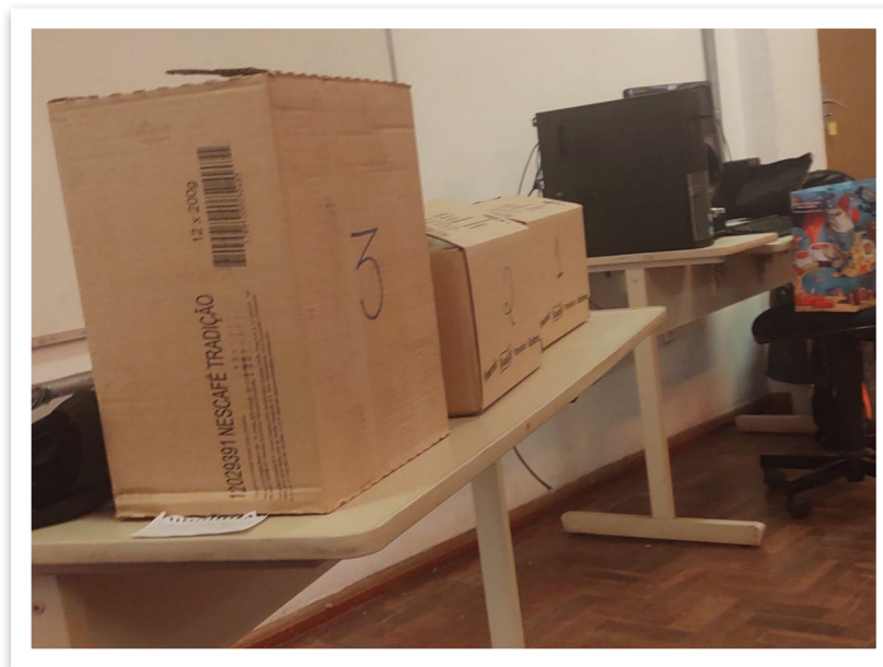
Foto 03: Recurso de caixas, onde os alunos escolhiam uma delas e deveriam fazer a associação do objeto com o autor/teoria (14.jul.25).