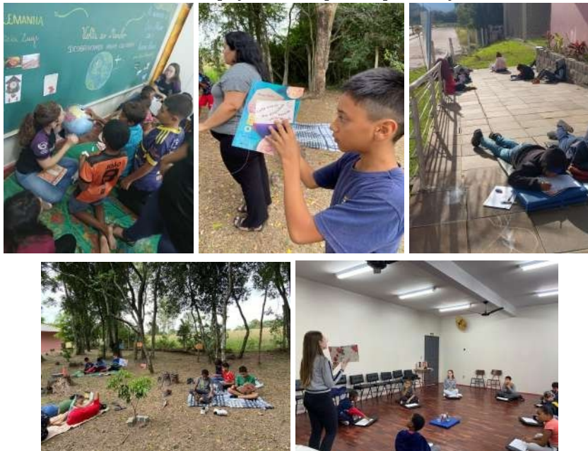
Figuras 1, 2, 3, 4, 5, 6, 7 e 8 : Espaços criados para a apresentação de diferentes textos literários.

Para que houvesse uma maior compreensão e interesse da turma, o desenvolvimento do livro foi realizado por etapas. Em primeiro plano, realizou-se o estudo de diferentes textos literários, possibilitando a ampliação do repertório dos/as estudantes através de uma leitura atenta e significativa. Observou-se que os momentos de leitura mediada, em consonância com a criação de espaços (Figuras 1, 2, 3, 4, 5, 6, 7, e 8), potencializaram a curiosidade, a compreensão das estruturas narrativas e as possibilidades ilustrativas presentes nas obras de literatura infantil.