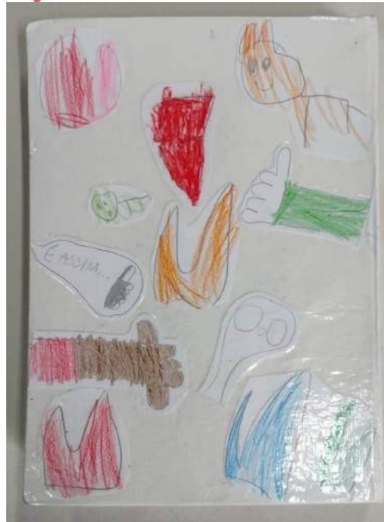
Figura 15. Capa do Livro feito com os desenhos das crianças (2024).