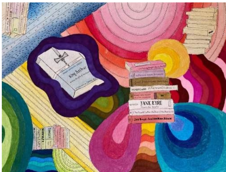
Figura 2. Sem título , técnica mista sobre papel, 29,7 x 42 cm, 2024

Como forma de representar a Biblioteca Pública do Paraná e seus elementos de maneira única, fomos incentivados a criar mapas mentais baseados na poética contemporânea de Franz Ackermann. Trata-se de um artista contemporâneo que produz obras centradas nos temas urbanismo e globalização. Ele começou a produzir trabalhos chamados de mapas mentais, onde misturava formas figurativas e abstratas como forma de representar o espaço urbano. As imagens a seguir foram criadas a partir das referências visuais do artista, somadas ao nosso olhar pessoal.