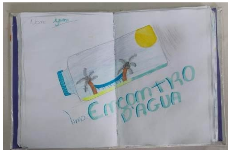
Figura 16. Desenho feito por uma das crianças (2024).