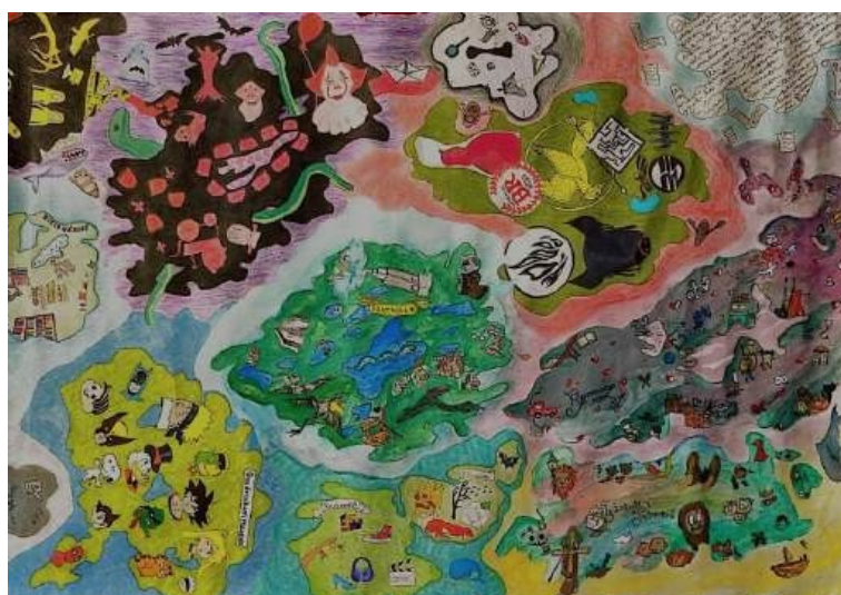
Figura 6. Mapa dos gêneros literários, lápis de cor, canetinha e aquarela sobre papel, 95x65cm, 2024.

Seguindo a ideia de urbanização, criamos também um mapa imaginário contendo a representação de alguns dos gêneros literários que podem ser encontrados na BPP. O mapa foi desenvolvido a partir de uma experimentação gráfico projetiva com grãos de arroz, projetados sobre a tela luminosa de um projetor. As sombras criadas se tornaram ilhas, e cada uma delas representa um gênero: Poesia, Suspense, Infanto-Juvenil, Quadrinhos, Romance, Biografias, Clássicos, Nacionais, Fantasia, Terror, Distopia, Investigação e Línguas. Esta proposta é de dimensão maior, e foi planejada e executada por todos os membros da equipe.