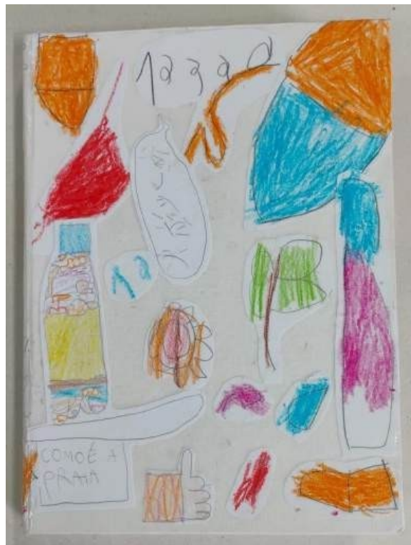
Figura 14. Capa do Livro feito com os desenhos das crianças (2024).

Os desenhos produzidos pelas crianças foram costurados juntos e se tornaram um caderno, como pode ser visto a seguir.