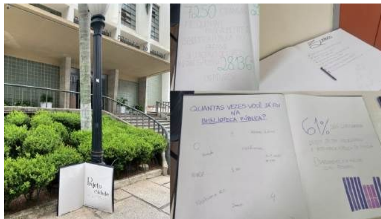
Figura 11. Caderno utilizado com intervenção sobre a BPP (2024)

O caderno foi mostrado ao redor da BPP, e depois passou a ficar exposto na Unespar, onde as pessoas poderiam lê-lo e intervir com suas respostas e experiências.