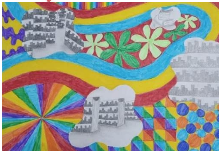
Figura 4. Sem título , grafite e marcador sobre papel, 29,7 x 42 cm, 2024

Seguindo a ideia de urbanização, criamos também um mapa imaginário contendo a representação de alguns dos gêneros literários que podem ser encontrados na BPP. O mapa foi desenvolvido a partir de uma experimentação gráfico projetiva com grãos de arroz, projetados sobre a tela luminosa de um projetor. As sombras criadas se tornaram ilhas, e cada uma delas representa um gênero: Poesia, Suspense, Infanto-Juvenil, Quadrinhos, Romance, Biografias, Clássicos, Nacionais, Fantasia, Terror, Distopia, Investigação e Línguas. Esta proposta é de dimensão maior, e foi planejada e executada por todos os membros da equipe.