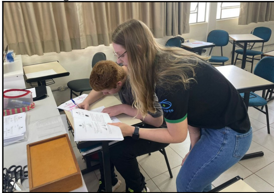
Figura 3: Professora estagiária em atendimento individualizado nas atividades..

Para consolidar a assimilação do objeto do conhecimento em foco, após as explorações realizadas, foi desenvolvido um exemplo na lousa envolvendo o cálculo de área e volume do cilindro, seguidos de uma lista de exercícios envolvendo a temática. Nesse momento, cabe destacar que uma atenção especial teve que ser direcionada ao aluno com laudo (Figura 3), que, por se tratar de um conteúdo mais extenso e algébrico, necessitou de acompanhamento para compreender e resolver alguns dos exercícios propostos.