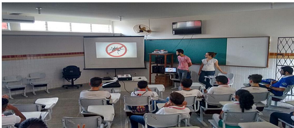
Figura 1: Alunos atentos à apresentação do vídeo.

Primeiro momento: Consistiu na apresentação do vídeo e de algumas curiosidades sobre o aedes . Pedimos para que os alunos se dividissem em dois grupos, um de meninos e outro de meninas, para criarem algumas perguntas sobre o que tinham entendido com o vídeo para desafiar o grupo “adversário” a responder corretamente. Pudemos observar o quanto os alunos se sentiram motivados pela “competição”, mostrando que realmente compreenderam as informações passadas.