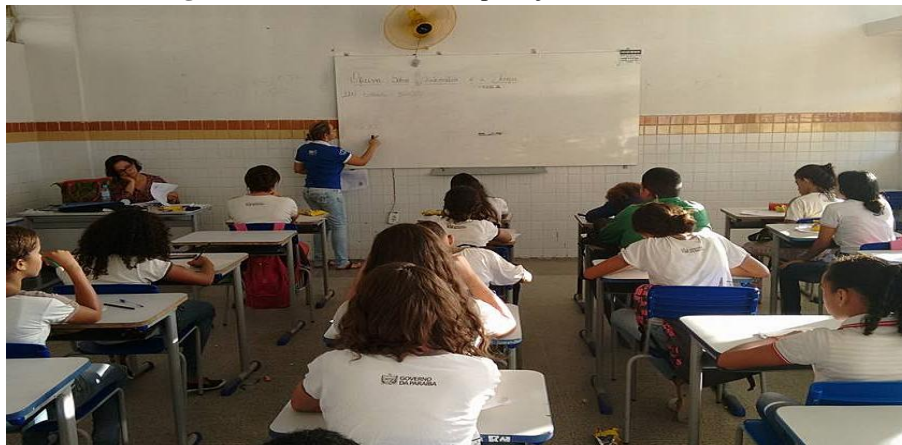
Figura 2: Alunos atentos à explicação na aula de revisão

Segundo momento: Houve a realização de uma aula teórica, em que explicamos todos os conteúdos que seriam trabalhados na apostila. A revisão foi feita em forma de aula expositiva. Pudemos amenizar algumas dificuldades apresentadas pelos alunos a partir dos seus conhecimentos prévios e da constante aplicação dos conceitos estudados a situações da nossa vivência. Assim, eles perceberam como a matemática está presente em nosso dia a dia e como ela pode nos ajudar a resolver vários problemas facilmente.