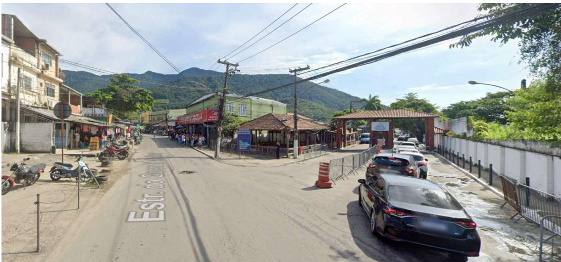
Figura 7: Entrada do Complexo de Gericinó (RJ)