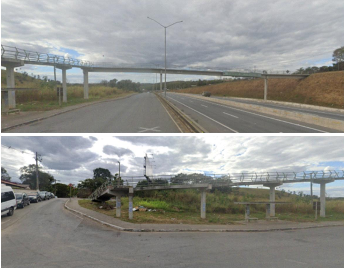
Figura 4: Passarela para acesso ao Centro de Referência à Gestante Privada de Liberdade – UMI (MG)