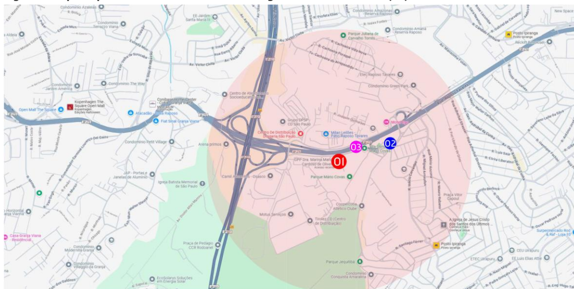
Figura 2: Mapa esquemático – CPP Dra. Marina Marigo Cardoso de Oliveira (SP)

01 - CPP Feminino "Dra. Marina Marigo Cardoso de Oliveira" de Butantan 02 - Creche Pública 03 - Transporte Público