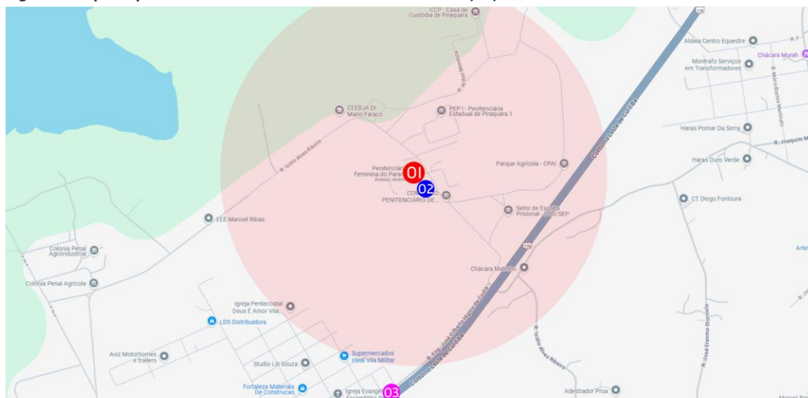
Figura 5: Mapa esquemático – Penitenciária Feminina do Paraná (PR)

01 - Penitenciária Feminina do Paraná 02 - Creche Anexa 03 - Transporte Público