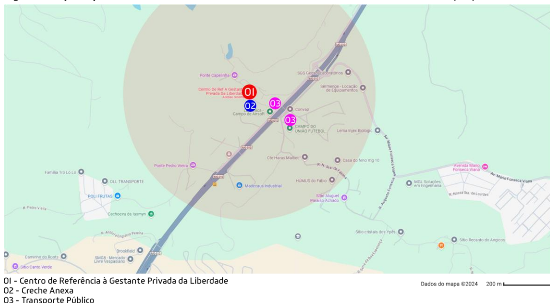
Figura 3: Mapa esquemático – Centro de Referência à Gestante Privada de Liberdade – UMI (MG)