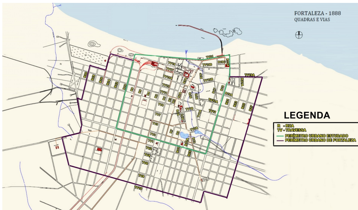
Figura 3: Ruas e travessas de Fortaleza (1890). Fonte: Planta da cidade de Fortaleza, capital da Província do Ceará, levantada por Adolpho Herbster (1888). Autora: Andrade (2012). Adaptado pelo autor (2019).

Desta forma, fazendo uma alusão ao novo tipo de governo, os vereadores decidiram por substituir os antigos nomes que estavam ligados ao império e, a partir da enumeração das ruas e travessas, faria com que houvesse a possibilidade de elencar novas personalidades para substituir as antigas denominações. A rua Formosa, atual Barão do Rio Branco, tornou-se a rua número 1, pois ela foi a primeira a ser aformoseada na cidade, daí o motivo de receber esta denominação. Partindo dela para o leste as ruas tiveram números ímpares e à oeste, pares (Figura 3 e quadro 5). O Boulevard do Livramento foi o escolhido para ser o norteador desta nova denominação, sendo as vias que seguiam para o norte receberiam números ímpares e para o sul, pares. Porém, um ano depois as denominações antigas voltaram a vigorar.