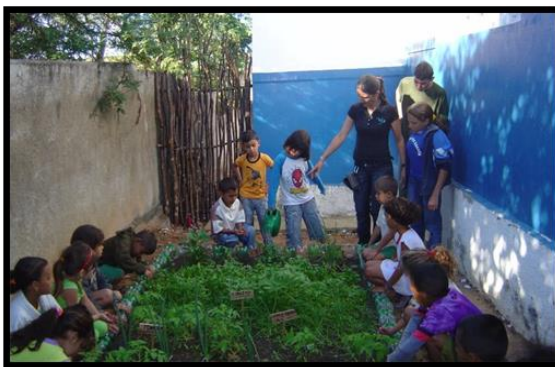
Figura 03: Projeto Farmácia Viva, 2008.