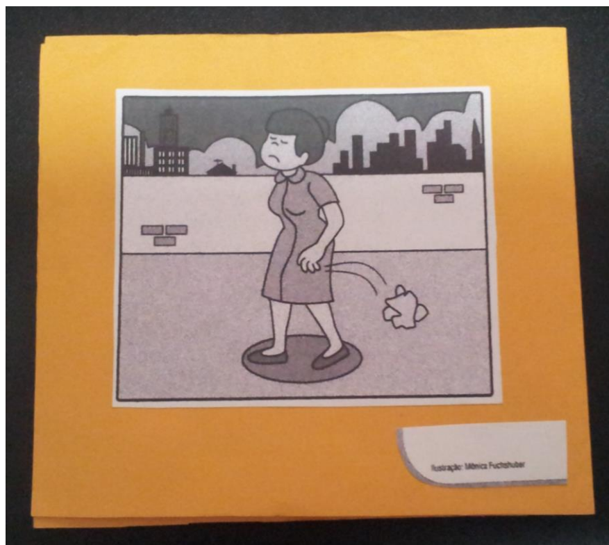
Figura 2. Livro textual: Produção de frases ambientais.

mediador das atividades em sala de aula quanto sensibilização e contextualização da temática em questão.