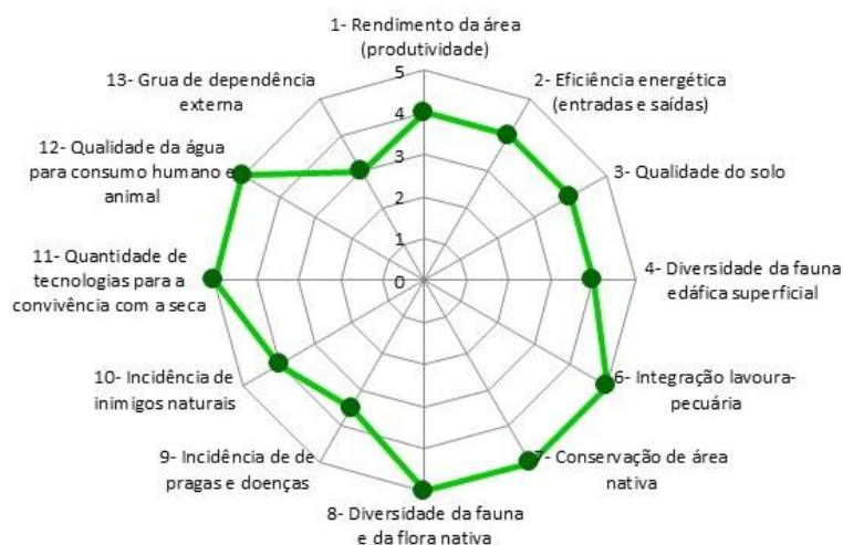
Figura 2 - Avaliação de sustentabilidade ambiental/técnico-agronômica.

Onde os níveis de sustentabilidade significam: 0 - insustentável; 1 – muito baixa; 2 – baixa; 3 – razoável; 4 – boa; 5- alta. Outubro de 2015.