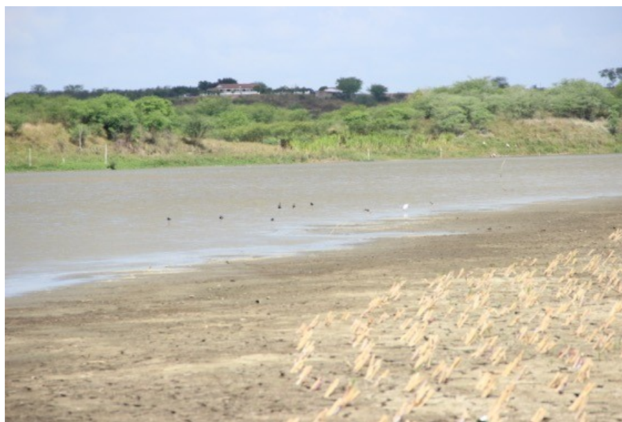
Figura 03: Atividades agrícolas e pecuária, primeiro ponto de coleta de dados, Curicaca.

Reportando a Figura 02, Barragem Campo Grande, observa-se que a turbidez na primeira coleta teve uma mediação entre alta com 37,5% e baixa com 62,5%, com qualidade variando de regular(17,65%) a boa (58,82%). Na segunda análise houve uma mudança significativa, com o percentual de muito alta chegando a 75% de certeza, qualidade péssima(47,37%) e boa (15,79%), alta e baixa com 13%, respectivamente, pois o mesmo,