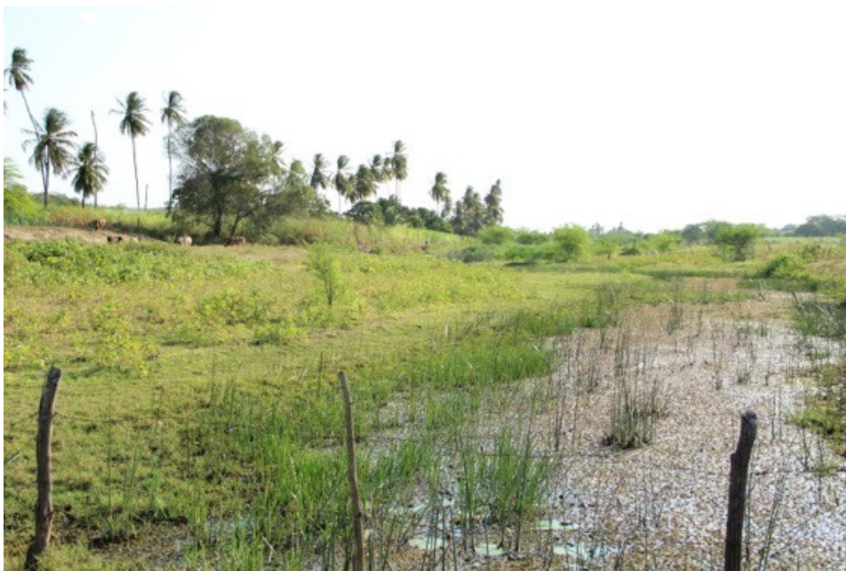
Figura 06: Comunidade de Boa Vista, quarto ponto de coleta de dados.

Sopesando a Figura 02 observa-se que na primeira coleta em Boa Vista encontrava-se um alto nível de turbidez, chegando a 87,5% com 70% da qualidade ser péssima, e apenas 12,5% da turbidez ser baixa com qualidade regular, 2%. Na segunda avaliação houve uma regressão em relação a primeira avaliação, a classificação da turbidez muito alta passou para 50% com qualidade de 25% para péssima e regular, respectivamente. A classificação para turbidez alta, também ficou em 50%, porém a qualidade péssima e regular ambas ficaram em 12,5%. Esse fato pode ser devido a retirada da vegetação para pasto ou talvez a retirada dos animais para repouso da vegetação (Figura 06).