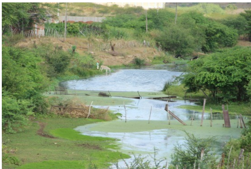
Figura 05: Comunidade do Juremal, terceiro ponto de coleta de dados.

Verificou-se que na comunidade do Juremal (Figura 02) 87,5% dos alunos avaliaram que o nível de turbidez do local está muito alto com qualidade péssima (98%) e apenas 12,5% que estava com turbidez alta. Na segunda coleta analisou-se o aumento crítico da turbidez, 100% avaliaram turbidez muito alta e qualidade péssima, isso pode ser consequência das atividades antropogênicas, pois há esgotos a céu aberto despejando dejetos no rio, associado a atividades de pecuária (Figura 05).