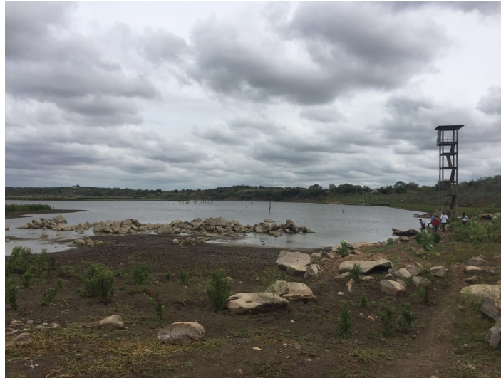
Figura 04: Barragem de Campo Grande, segundo ponto de coleta de dados.

recebe uma certa quantidade de esgoto, tem residências próximas e também acontece atividade agrícola e pecuária (Figura 04).