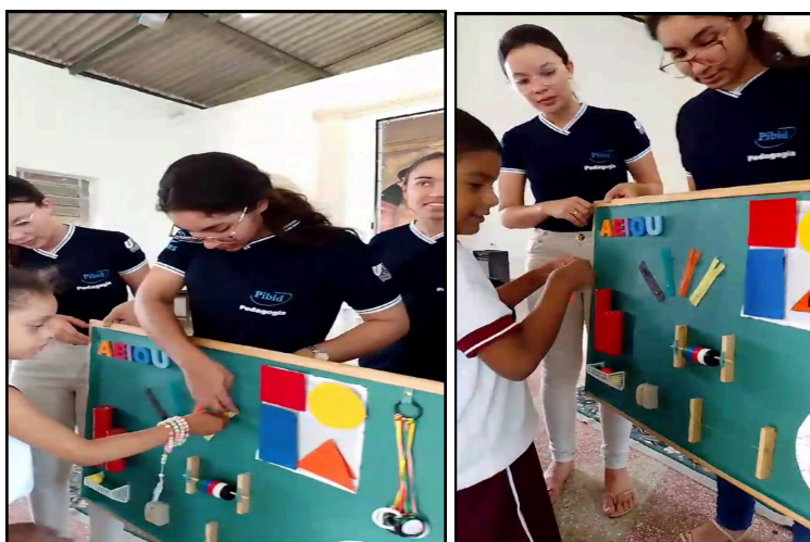
Imagem 4: Aplicação do projeto “ Explorando os sentidos”.