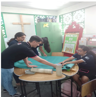
Imagem 1: Construção do painel sensorial

Ao utilizar o quadro sensorial com as crianças da educação Infantil, percebe-se que atraiu bastante a sua atenção por meio das cores, formas que lá possuía. Elas exploraram bastante os objetos, estimulando o seu conhecimento. Como resultado da construção do painel com os materiais utilizados, ajudaram a estimular os sentidos das crianças por meio das cores vibrantes, dos barulhos e das texturas que podem ser encontradas. Além disso, através da utilização deste quadro, foi possível trabalhar os movimentos, coordenação motora, além de tocar os materiais do painel, como abrir o zíper ou apertar algo. Isso é muito importante, pois desperta o conhecimento da criança e favorece a sua aprendizagem, além de ser uma atividade divertida.