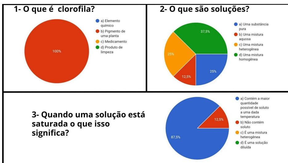
Figura 03: Resultado das perguntas feitas no questionário de sondagem.

Além das que objetivas que apresentam na figura 03, algumas questões subjetivas foram levantadas, como "Qual seria a sua maior dificuldade na disciplina de química?" As respostas foram bastante genéricas, contudo a maioria indicou uma aversão às disciplinas de exatas.