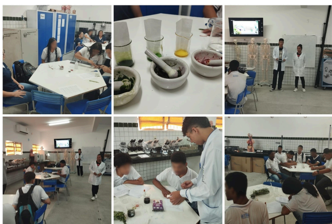
Figura 04: Coletânea de fotos da execução do experimento.

O experimento permitiu que os alunos reforcem o aprendizado, conectando teoria à prática, assim podendo desenvolver habilidades essenciais que facilitem o pensamento crítico e possam elevar a simular situações reais. A experimentação no ensino de ciências é amplamente apoiada, com muitas pesquisas destacando seus efeitos positivos na motivação e interesse dos alunos. Professores observam que a experimentação desperta um forte interesse entre os alunos, tornando o aprendizado mais lúdico e sensorial. (Lima, Vaz, 2020).