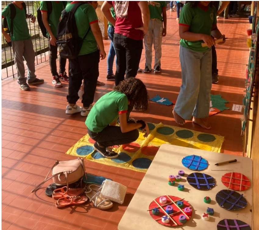
Figura 03: Jogos com materiais reaproveitados.