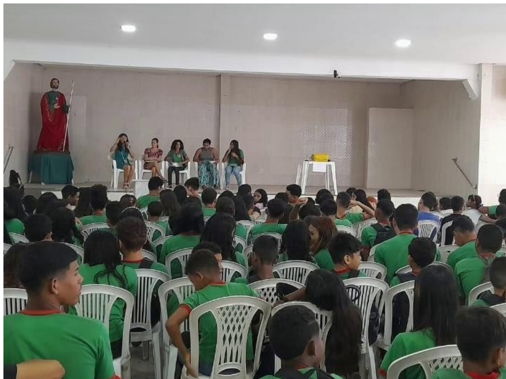
Figura 02: Diálogos é rodas de conversa.