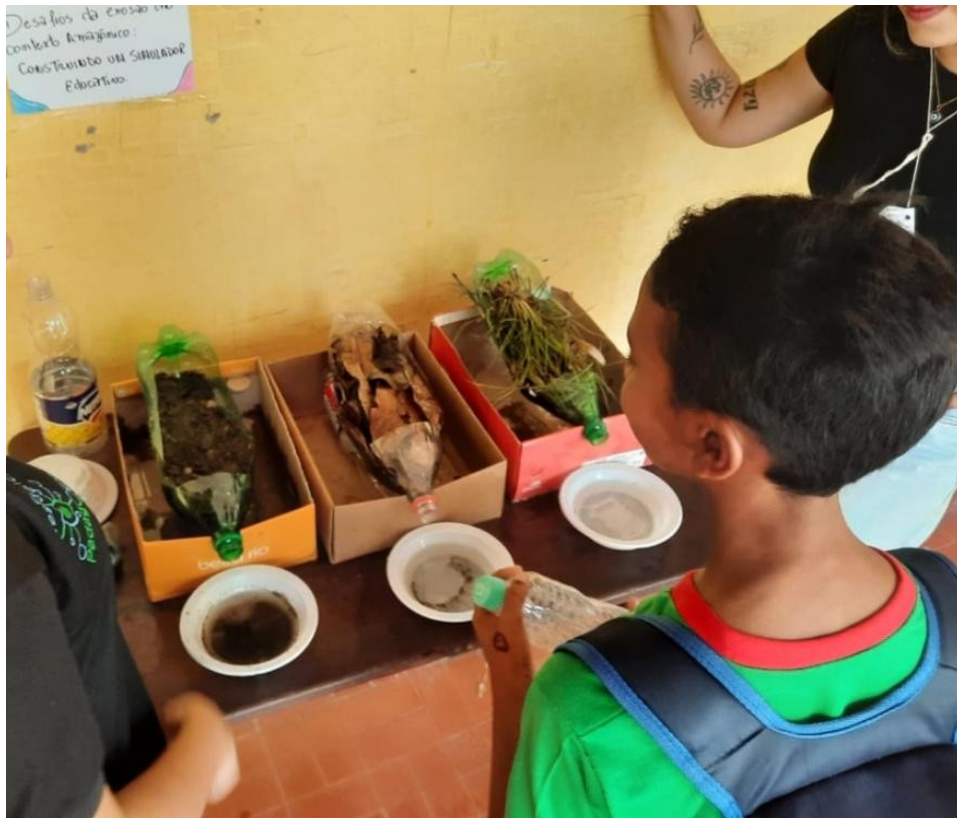
Figura 04: Oficina sobre Processos Erosivos.