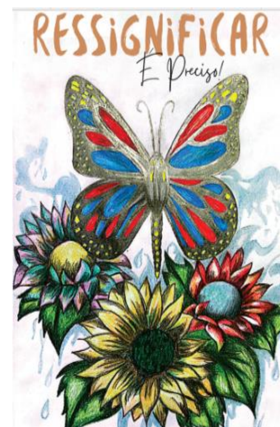
Figura 02: Capa do Livro

A maioria dos alunos demonstrou indícios de uma compreensão do conceito de resignificação, demonstrando indícios de capacidade de refletir sobre suas experiências e identificar formas de atribuir novos significados a elas. Tendo como culminância a produção de um livro.