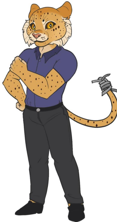
Figura 05 – O HOMO SAPIENS JAGUAR-GESTARE

Assim, com alicerce em todo o exposto, referenciando, nos desdobramentos do ilustre Walmor Correa e do antropomorfismo. É da seguinte maneira que se representa o corpo-gestão escolar, segundo a visão do autor desse artigo: