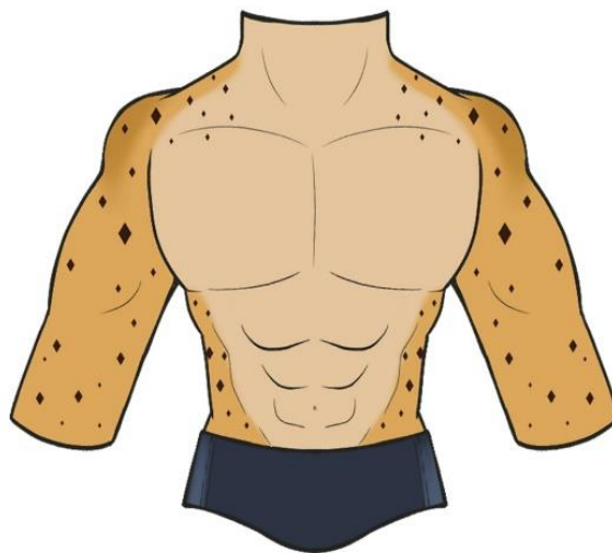
Figura 01 – Tronco híbrido.