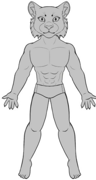
Figura 03 – Sentidos do gestar.

Eu penso renovar o homem usando os sentidos de uma onça. (autoria própria, 2024).