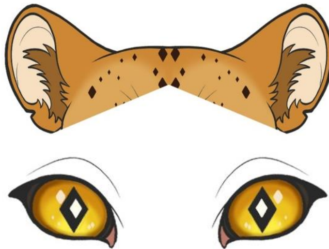
Figura 02 – Sentidos do gestar.