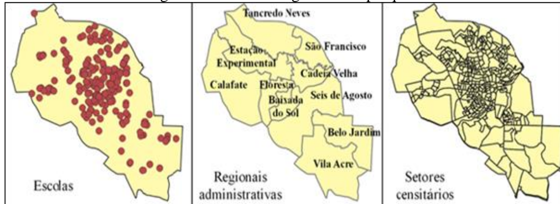
Figura 1 – Bases cartográficas da pesquisa