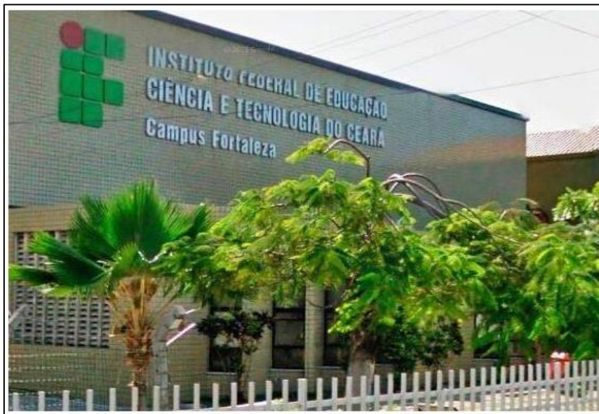
Figura 1 - IFCE - Campus Fortaleza

O IFCE - Campus Fortaleza (Figura 1) fica localizado na Avenida Treze de Maio, n.º 2081 - Benfica, inaugurado em 1952 ainda sob a denominação de Escola Industrial de Fortaleza.