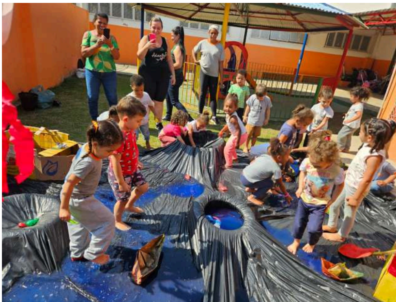
Figura 9 - Inserção de novos elementos na área externa da instituição

Como parte do processo de elaboração do PMPI do município de Juiz de Fora, todos os dados produzidos na escuta realizada nas creches parceiras, foram discutidos no interior dos Grupos de Trabalho do Comitê Intersetorial pela Primeira Infância, sendo, em momento posterior, integrado ao Quadro Operativo dos sete Eixos Estratégicos do Plano, a saber: Direito à Educação Infantil; Direito à Saúde; Direito à Assistência Social; Direito à Diversidade; Direito à Proteção contra todas as formas de violência; Direito a ter direitos; Direito à cidade.