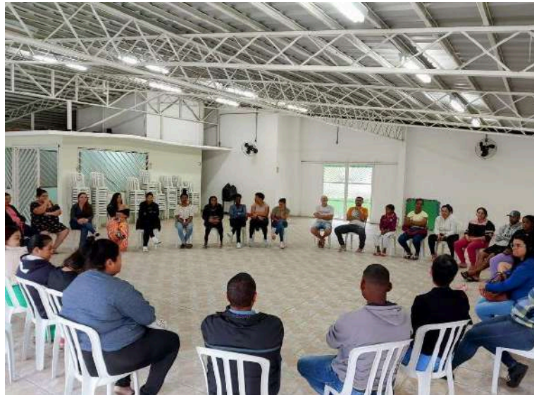
Figura 2 - Diálogos entre profissionais e famílias sobre o PMPI

O próximo registro (Fig.2) revela um encontro realizado com as profissionais das creches e as famílias dos bebês e das crianças para fomentar os diálogos sobre o PMPI.