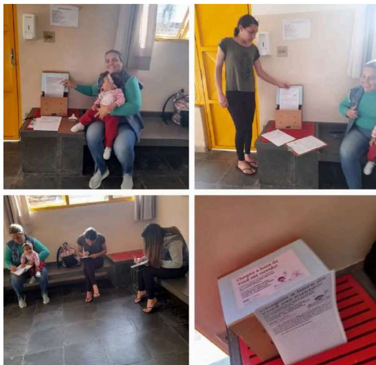
Figura 1 - “Caixa de Escuta” para participação das famílias

O trabalho de escuta das profissionais, das famílias, dos bebês e crianças envolveu 46 creches parceiras do município. O primeiro trabalho realizado iniciou-se com um movimento intenso de escuta das famílias e das equipes de profissionais que atuam nas instituições, e que participaram por meio de diferentes instrumentos, tais como: respostas a questionários; rodas de conversa e “caixa de escuta”, onde registravam suas sugestões; por meio de conversas pelo Whatsapp, telefonemas, além dos diálogos tecidos no cotidiano da instituição. A Fig. 1 traz um registro sobre a “Caixa de Escuta”, localizado no hall de entrada de uma das instituições: