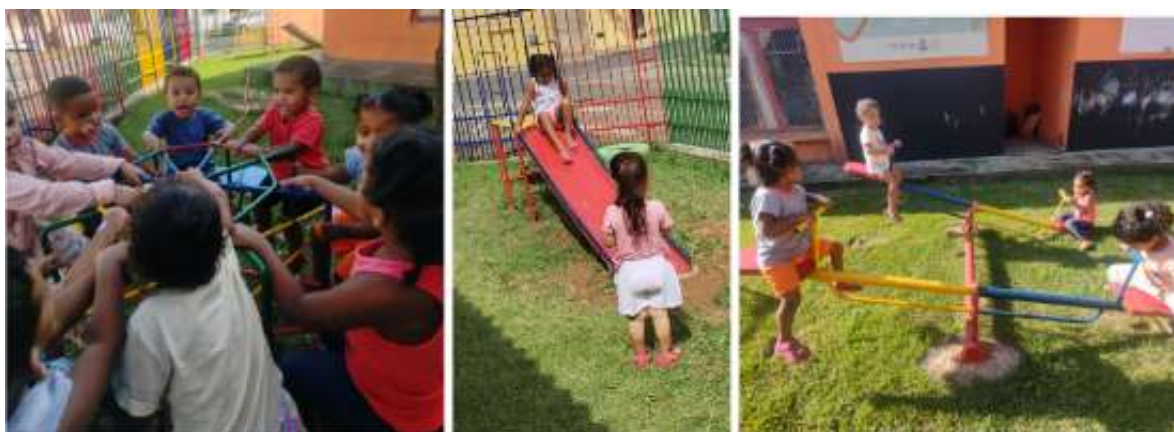
Figura 7- Após transformações do Parquinho - crianças brincando com autonomia