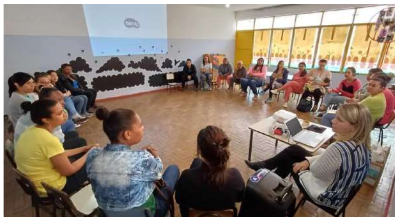
Figura 3 - Formação com profissionais das Creches Parceiras promovida pela SAPIP/DEI/SE

Nesse processo, aconteceram vários encontros formativos com a equipe da SAPIP/SE junto às coordenadoras das creches, como demonstra a Figura 3. Como ponto de partida, foi utilizada a planta baixa da creche como base para as observações, por considerarmos que esse é o espaço que é ofertado para os bebês que chegam na instituição. Utilizando essa planta baixa, as coordenadoras, junto aos demais profissionais, iniciaram as observações do coletivo da instituição, buscando identificar quais são as vivências que acontecem cotidianamente dentro das rotinas.