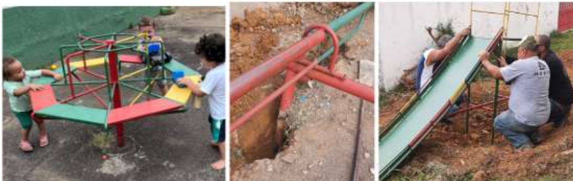
Figura 6 - Antes e durante a transformações do Parquinho

Na Figura 5, é possível observar as propostas de intervenções no Pátio Externo da creche. Neste ambiente, a coordenadora traz o relato de que o parquinho era pouco utilizado pelas crianças, já que, por ter uma estrutura alta (na perspectiva das crianças de 0 a 3 anos), as professoras temiam utilizá-lo. Por estar situado em um piso de cimento, como alternativa, o grupo decidiu transferi-lo para uma área gramada. Além disso, realizaram adaptações nos brinquedos, cavando a terra de modo que sua base ficasse dentro do chão (em alguns casos, foi necessário retirar parte da base). Ao diminuir a altura dos brinquedos, os bebês e as crianças puderam utilizá-los com segurança. Esse processo é evidenciado nas Figuras 6 e 7 a seguir.