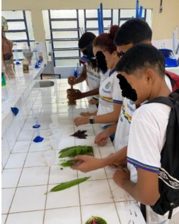
Figura 3 — Fisiologia vegetal