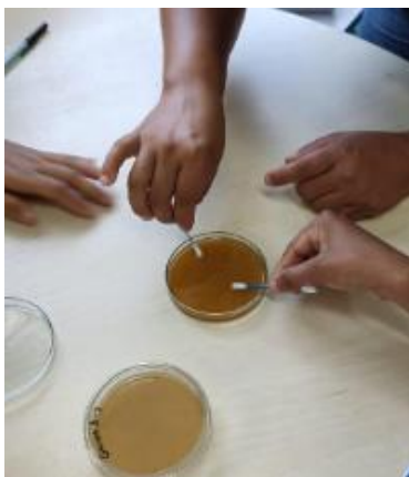
Figura 1 — Cultivo microbiótico