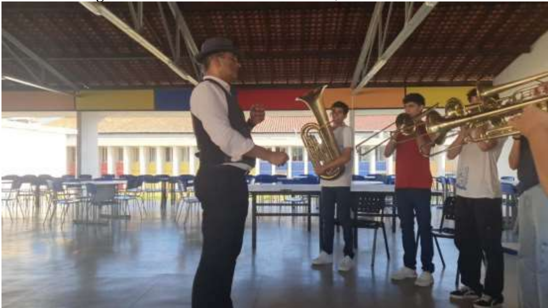
Figura 4- Curso de extensão Trombone, Tuba e Bombardino

de mimese para explicar os aspectos da construção do som no instrumento, com ênfase em: alongamentos da musculatura superior, alongamento da musculatura facial, treinamento de respiração, produção de som com o bocal, produção de som no instrumento, notas longas, flexibilidades e escalas. Observamos na Figura 4 o registro dessa etapa do curso de extensão.