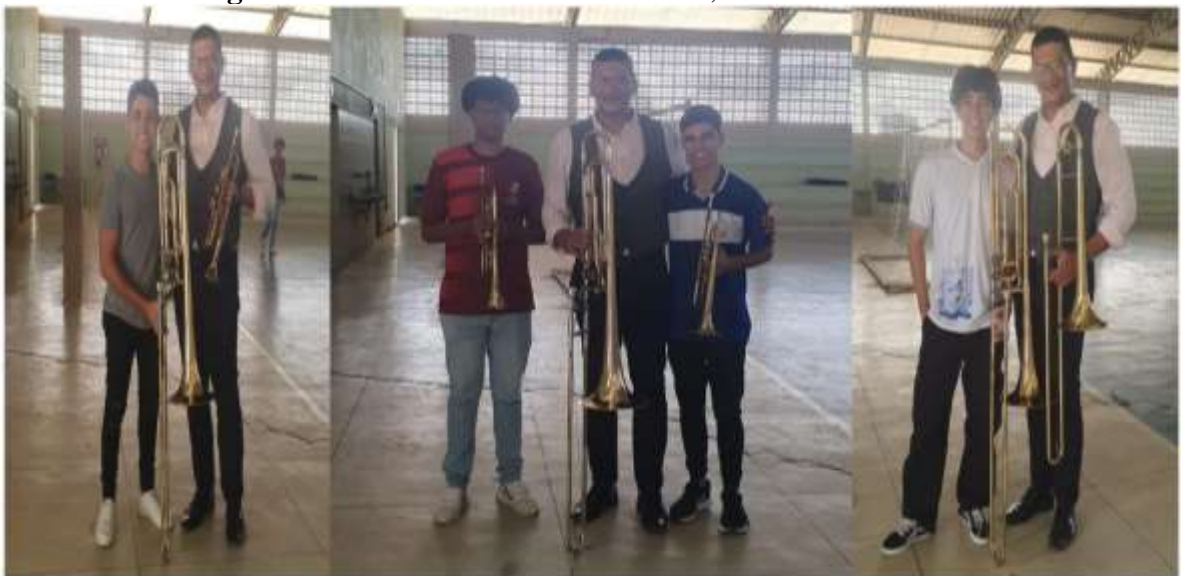
Figura 3- Curso de extensão Trombone, Tuba e Bombardino

Os alunos participaram ativamente e dedicaram atenção a todos os ensinamentos repassados pelo maestro, replicaram as técnicas ensinadas e ao final da abordagem além de tirar todas as dúvidas e questionamentos dos alunos, o maestro tocou uma música, acessível pelo link : https://www.instagram.com/reel/C8Doooc-o0v0/?igsh=Z2J2ZXlzMDBhN3do , além de tirar fotos individuais com os alunos, conforme podemos observar na Figura 3.