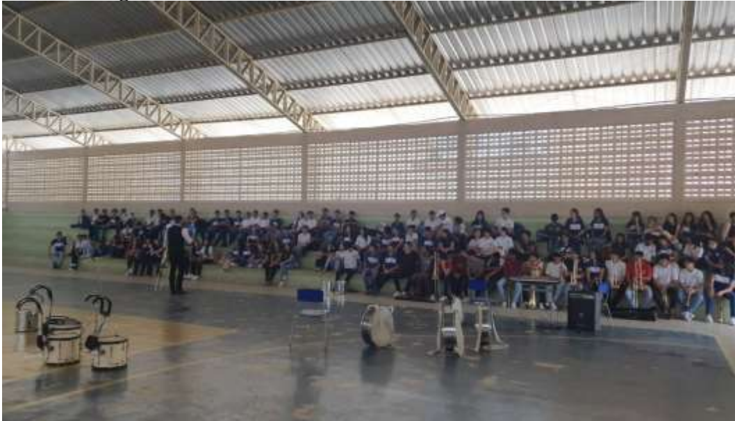
Figura 2- Curso de extensão Trombone, Tuba e Bombardino