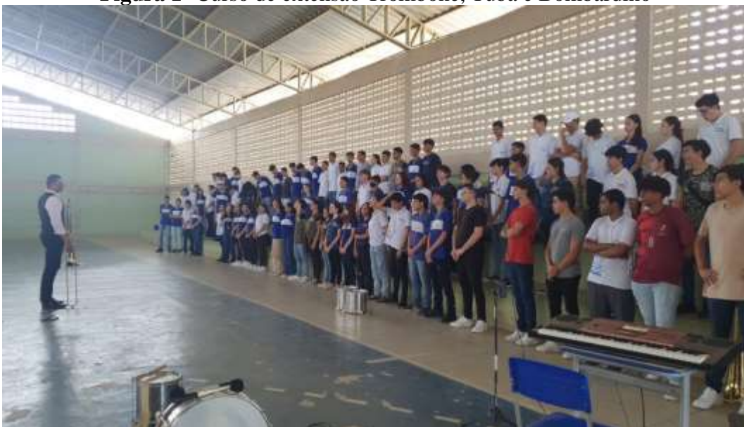
Figura 1- Curso de extensão Trombone, Tuba e Bombardino

Neste minicurso o maestro buscou trabalhar o desenvolvimento das capacidades técnico/artísticas através do estudo especializado do Trombone, Bombardino e Tuba tanto para os alunos iniciantes como para os alunos que já tocam estes instrumentos na BAMACC. Vale destacar que essa intervenção pedagógica faz parte de um projeto desenvolvido na UFCG.