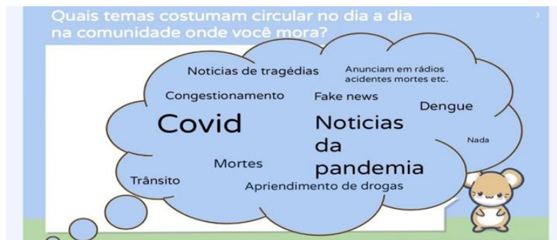
Figura 02: Ilustração de um método usado nas aulas por alguns residentes.

Transformar as aulas em ambientes mais atrativos foi um do objetivo dos bolsistas, a fim de obter maior contribuição dos alunos eram utilizados mapas mentais nuvens de palavras conforme ilustrado na figura 02 abaixo: