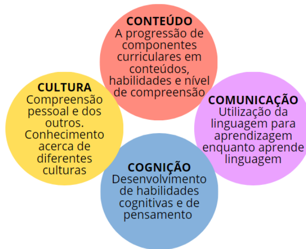
Figura 3: Os 4Cs do Content and Language Integrated Learning (CLIL).

A abordagem CLIL se baseia em princípios pedagógicos que visam aprofundar a compreensão dos alunos tanto em relação ao conteúdo quanto à língua. A Figura 3 apresenta os 4Cs da abordagem, que correspondem à cultura, conteúdo, cognição e comunicação. Todos esses aspectos devem ser pensados e planejados quando consideramos criar um projeto ou sequência didática envolvendo o CLIL. Os "4Cs" do projeto CLIL (Content and Language Integrated Learning) que aborda problemas globais em uma perspectiva local são uma estrutura que visa orientar o desenvolvimento e a execução bem-sucedida de um projeto educacional que integra conteúdo curricular, habilidades linguísticas e temas globais pertinentes.