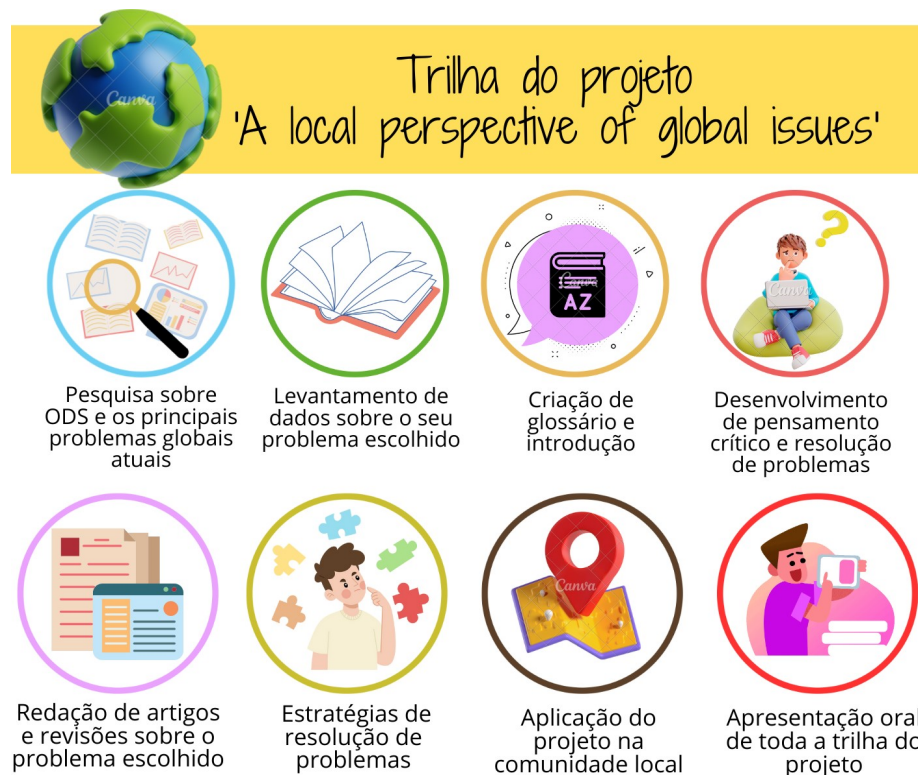
Figura 4: Trilha didática do projeto 'A local perspective of global issues', contendo os passos utilizados no desenvolvimento das atividades.

Uma sequência didática de 20 aulas foi criada para atender às necessidades do projeto. A Figura 4 apresenta um esquema representativo com um breve resumo de quais foram os passos trilhados pelos alunos na execução da atividade.