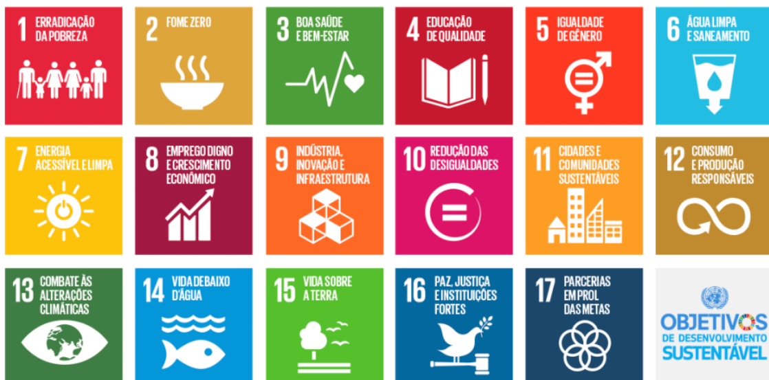
Figura 1: Objetivos de Desenvolvimento Sustentável da Organização das Nações Unidas.

A preocupação de diversas organizações mundiais para com o futuro do Planeta tem ganhado destaque em diversos eventos globais. O website desenvolvido pela Organização das Nações Unidas no endereço eletrônico https://sdgs.un.org/goals aponta os Objetivos de Desenvolvimento Sustentável (ODS), criados como parte principal da Agenda 2030 para Desenvolvimento Sustentável. O compromisso para com os ODS foi firmado por todos os 193 países presentes na Cúpula das Nações Unidas sobre o Desenvolvimento Sustentável em 2015, e os mesmos estão apresentados na Figura 1.