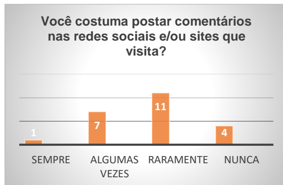
Gráfico 2 – Imagem da autora

Constatamos que dos 23 jovens que responderam o questionário, a maioria utiliza o celular no cotidiano, como mostra o gráfico 1. No entanto, apenas 1 deles sempre posta comentários; 7 interagem algumas vezes; 11 deles raramente postam comentários e 4 alunos nunca interagem na mídia por meio de comentários on-line .