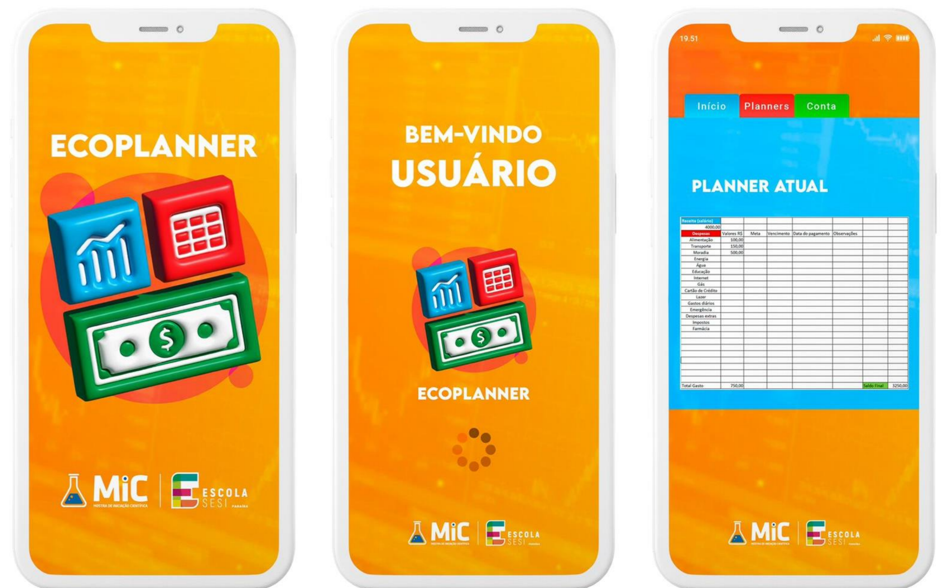
Figura 02: Idealização do aplicativo.

O EcoPlanner contaria com alertas sonoros e vibratórias ao ultrapassar os valores determinados pela sua meta de gastos no mês; disponibilizaria notificações para lembrar os usuários de pagar contas, economizar ou verificar seu progresso financeiro regularmente. Permitiria que os usuários integrem suas contas bancárias para obter uma visão abrangente de suas finanças e calculadora para auxiliar nos cálculos de seu controle financeiro.