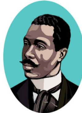
João da Cruz e Sousa