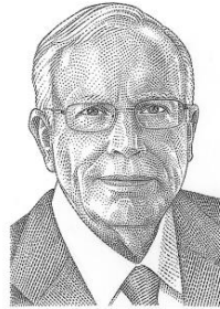
James J. Heckman é professor emérito de economia "Henry Schultz" da Universidade de Chicago e ganhador do Prêmio Nobel de Economia.