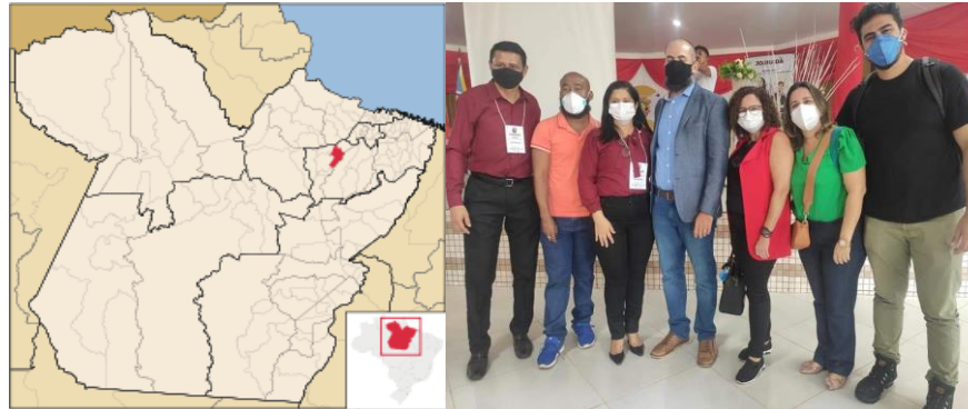
Neurociência e Educação

a) Contexto da ideia: Curso de Formação Continuada de Professores (Março/2022).