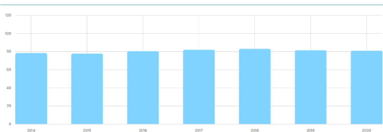
Taxa de Atendimento - Brasil