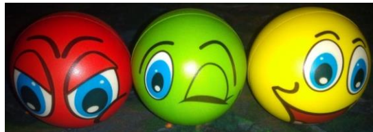
Figura 3 – Escala de Likert concreta