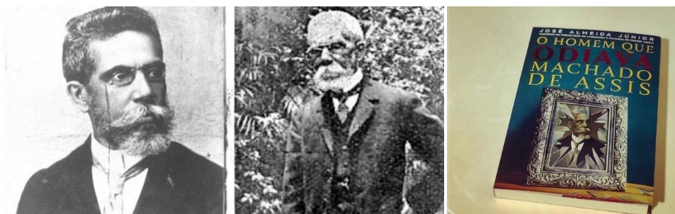
À esquerda foto que costuma ser vinculada aos livros impressos e expõe a imagem do embranquecimento do escritor, à direita a foto que retrata os traços e a cor da pele do escritor.

Ao compararmos as fotografias veiculadas e disseminadas na maior parte dos livros didáticos e paradidáticos, a imagem que costumamos ver nas capas, contracapas e páginas remetem à cultura do embranquecimento do autor.