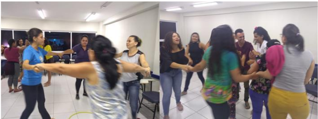
Figura 1 – Experimentação corporal do brincar e do dançar.

Em seguida, com base em Le Boulch (2008), a direção dos estudos se configurou por meio da conscientização corporal, exploração espacial e óculo-manual, lateralidade, equilíbrio, percepção temporal e experimentações das habilidades motoras amplas e finas, bem como as demais capacidades físicas, proatividade, cooperação e dialogicidade, de acordo com as necessidades educativas e possibilidades gestuais dos estudantes. Dessa forma, houve um exercício reflexivo da realidade escolar, bem como nas características biológicas e culturais das crianças nos diversos contextos socioeducativos existentes, com o intuito de potencializar a inteligência, a memória e a capacidade de aprendizagem escolar das crianças.