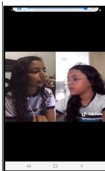
AUTORIA DA IMAGEM: Atividade perguntas e respostas em dupla a distância com uso do app tik tok DATA: 12/08/2020