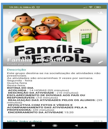
Nova sala de aula

Alguns registros são apresentados abaixo de atividades de ensino não presencial realizado na educação infantil.