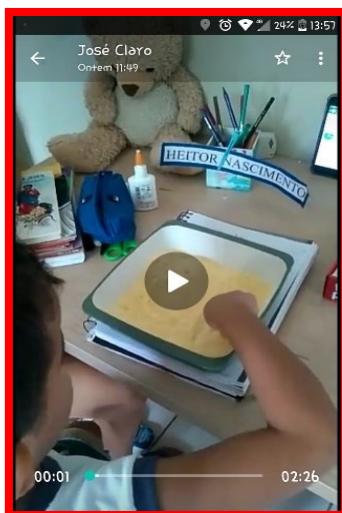
AUTORIA DA IMAGEM: Imagem: criança realizando atividade sensorial. Data: 27/08/2020