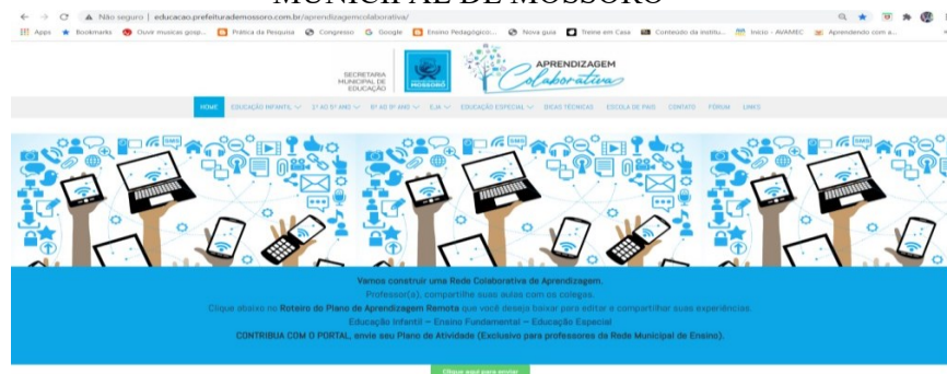
Fig 1- SITE DO PORTAL DE APRENDIZAGEM COLABORATIVA DA PREFEITURA MUNICIPAL DE MOSSORÓ