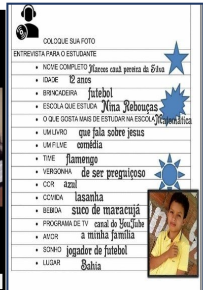
AUTORIA DA IMAGEM: Atividade entrevista realizada em app gratuito cymera DATA: 25/08/2020

O problema maior nesse contexto tem sido a dificuldade para os alunos manterem acesso às tecnologias digitais, até mesmo pela situação econômica de cada aluno. Em sua maioria apresenta grandes dificuldades para acompanhar o ritmo das aulas uma vez que provém de