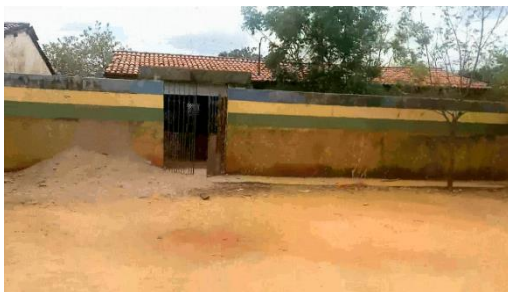
Figura 05: Escola Pedro Tomás de Moura.