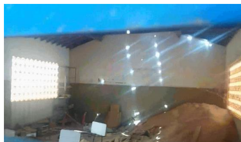
Figura 06: Sala de aula da Escola Pedro Tomás de Moura.

Nesse caminhar pelas veredas da memória, consideramos importante visitar a escola, fato que nos permitiu refletir sobre que representação/significação as gerações que por ali circulam diariamente, atribuem à essa escola? Provavelmente, uma escola “abandonada”, porém para Gerardo, símbolo que ainda alimenta a memória de uma família que se dedicou à escolarização? Símbolo de prestígio em remotos? Que situações se interpuseram nessa trajetória que tornaram a escola inadequada ou impossibilitada de funcionar?