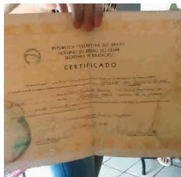
Figura 04: Certificado do Ensino Supletivo.