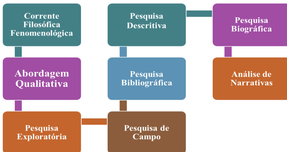
Imagem 01: Percurso Metodológico.

A produção deste trabalho conforme expõe a imagem 01, recorre um percurso metodológico contemplando a corrente filosófica fenomenológica, partindo para uma abordagem qualitativa, utilizou-se como procedimentos metodológicos os pressupostos da pesquisa exploratória, descritiva, bibliográfica e de campo, quanto a análise dos resultados usou-se a pesquisa biográfica com a técnica de análise das narrativas.