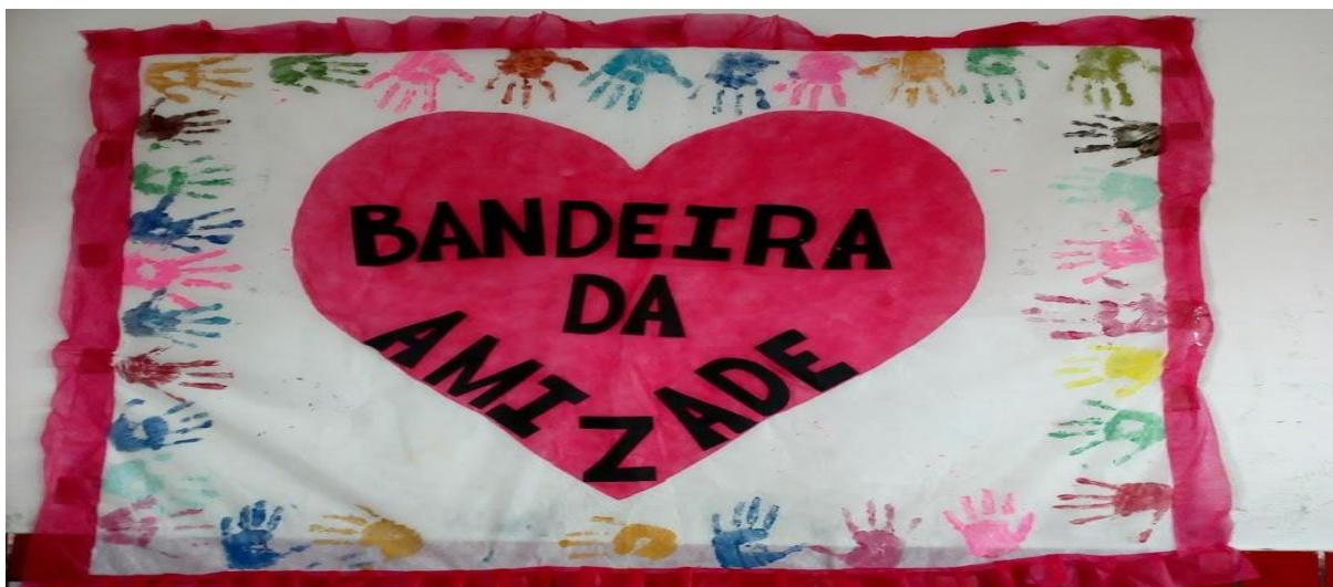
IMAGEM 3: Bandeira produzida pelos alunos do 4º ano para representar o projeto.

Todos participaram cada turma apresentando o valor escolhido, todos estavam muito eufóricos, abrimos o projeto com sucesso e apoiado por todos. Foi uma tarde inesquecível. Durante os outros dias de projeto, conversamos sobre a importância da amizade, descrevemos o melhor amigo para a criação do livro da amizade e confeccionamos a bandeira e identificação da turma (IMAGEM 3)