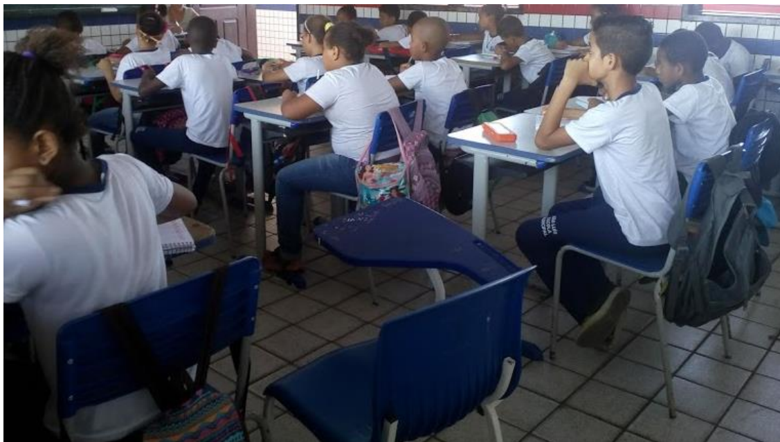
IMAGEM 1: Turma do 4º ano pesquisada