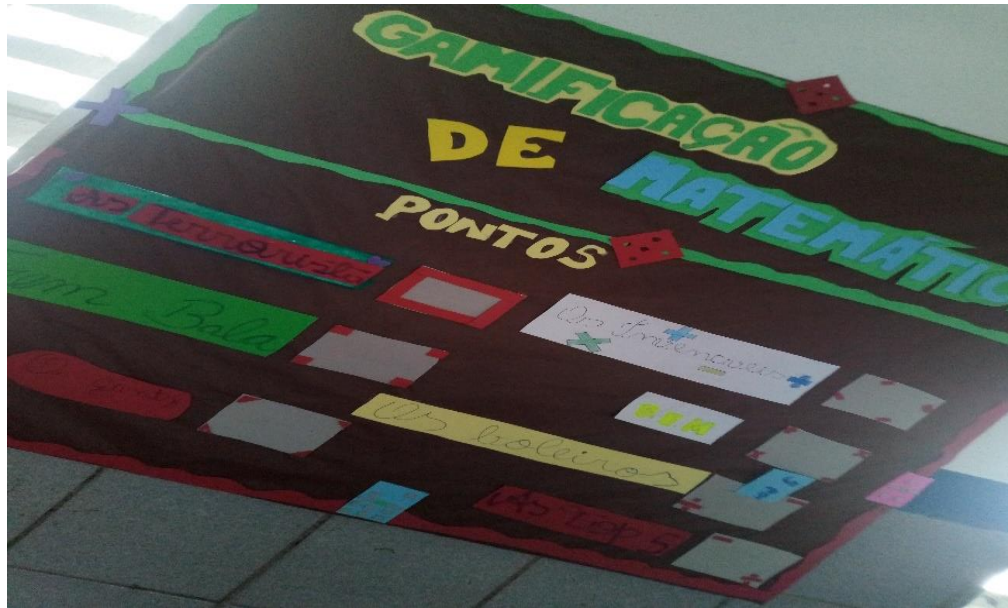
Figura 4: Painel com placar