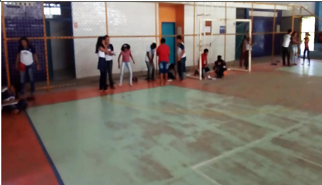
Figura 3: Aula no ginásio da escola.