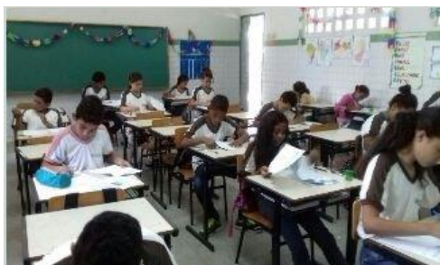
Fig. 3 e 4 – Alunos durante a aplicação da prova

3º Momento: Os alunos do 6º, 7º e 8º participaram da prova da I OIMEAA, no dia 30 de maio de 2017. A prova continha 20 questões interdisciplinares e de raciocínio lógico, seguindo os critérios e as normas da OBMEP. Cada Turma ficou em suas respectivas salas. A prova foi aplicada no turno da manhã das 7h às 9h totalizando 2 horas de prova. Demos as instruções de que não poderiam responder com lápis grafite, nem rasurar o gabarito, e deveriam preencher os dados corretamente. Eles deveriam permanecer na sala durante a primeira hora, mas não poderiam levar o caderno de questões até que faltassem 30 minutos para o término.