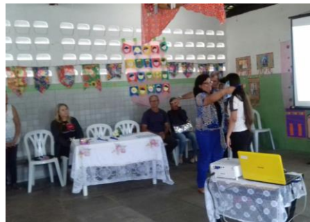
Fig. 5,6,7 e 8 – Alunos durante a premiação dos primeiros colocados