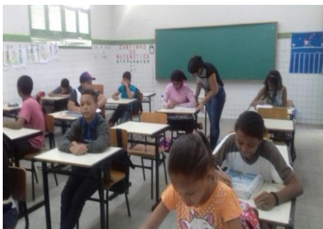
Fig. 1 - Aulão preparatório