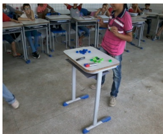
Figuras 2 e 3 – Vivência do ‘jogo da conquista no coletivo – três grupos

Para iniciar o jogo, um representante de cada equipe vinha até o centro da sala retirava duas tampas (uma de cada cor), realizava a multiplicação e representava o resultado no quadriculado colado no quadro. Vejamos as Figuras 2 e 3 a seguir.