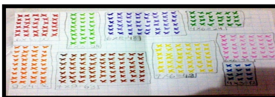
Figura 5 – Registro de ditado da multiplicação