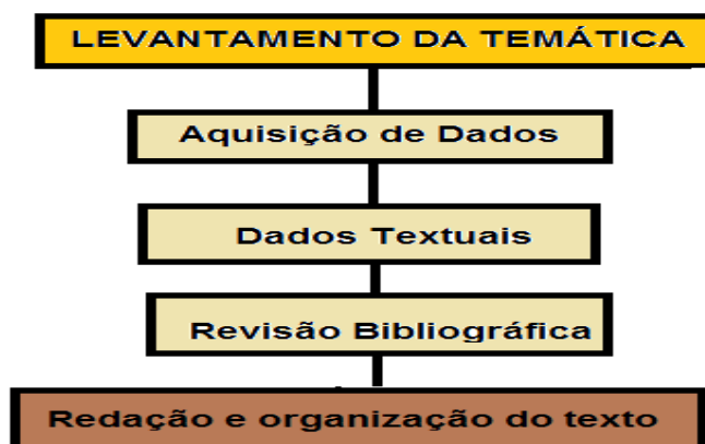
Figura 01. Fluxograma da metodologia utilizada.

O desenvolvimento da pesquisa se deu por meio de uma revisão bibliográfica de textos, artigos e teses publicadas em revistas e sites de universidades do Brasil – com a temática base “Ensino de Geomorfologia”, juntamente com análises das grades curriculares dos cursos de Licenciatura em Geografia de importantes universidades do país. Após a leitura e análise desses trabalhos, foi realizado o levantamento e tratamento dos dados, buscando aferir às informações necessárias a realização desse estudo. A seqüência metodológica utilizada no presente estudo está representada no fluxograma a seguir: