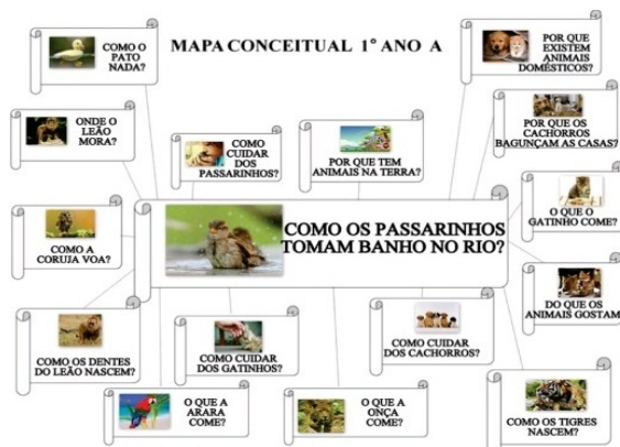
Figura 2 - Modelo de mapa conceitual da E.E. João Brembatti Calvoso, turma 1º ano B – ensino fundamental – séries iniciais.

Na figura 2, temos um exemplo de mapa conceitual produzido pelo 1º ano A do Ensino Fundamental I, os alunos querem saber como os passarinhos tomam banho no rio e através dessa pergunta se segue vários outros questionamentos.