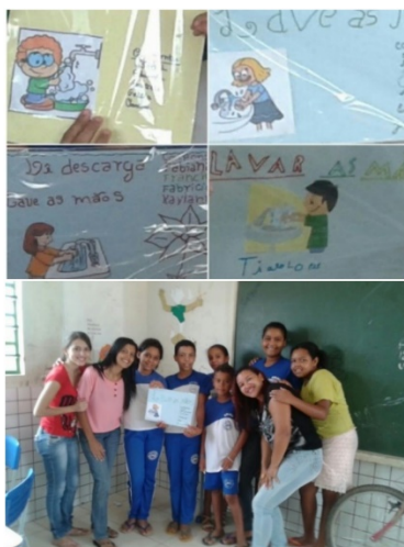
Figura 03 – placas de orientação de higiene

É importante salientar que os professores exercem papel importante na medida em que educam, motivam, ao mesmo tempo em que desenvolvem uma consciência crítica, despertando o interesse pela manutenção da saúde (SANTOS; RODRIGUES, 2003). Através da observação do comportamento, nível de participação e análise dos trabalhos e materiais confeccionados pelos próprios alunos, nota-se que a prática desses tipos de atividades e utilizando essas metodologias, consegue-se atrair o interesse dos alunos e com isso elevar o nível de aprendizagem. Como também, o tema tratado, higiene pessoal, contribui para a formação de cidadão conscientes da importância do hábito de higiene pessoal, o que leva a uma melhora significativa da qualidade de vida e saúde, hoje e futuramente, já que as crianças são o futuro da população. Esses tipos de atividades incentivam o trabalho em equipe, desta forma além de cidadãos conscientes quanto à higiene, colabora também para a formação de cidadãos aptos a viverem e se portarem em sociedade.