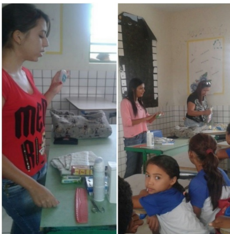
Figura 01 – exposição dos materiais de higiene

Na segunda atividade notou-se que alguns materiais de higiene, por exemplo o sabonete, eles sabiam como utilizar, outros não, como o cotonete, pois eles não sabiam que o cotonete deve ser utilizado apenas nas partes externas da orelha e que a melhor forma de limpar os ouvidos sem correr o risco de machucar é utilizando uma toalha limpa, e ficaram surpresos ao saber que a cera produzida pelo ouvido funciona como proteção e não deve ser retirada por completa. E ainda, eles demonstraram uma curiosidade em aprender a maneira e frequência correta de utiliza-los, através de algumas perguntas feitas por eles mesmos ao longo da exposição dos materiais. (Figuras 01 e 02).