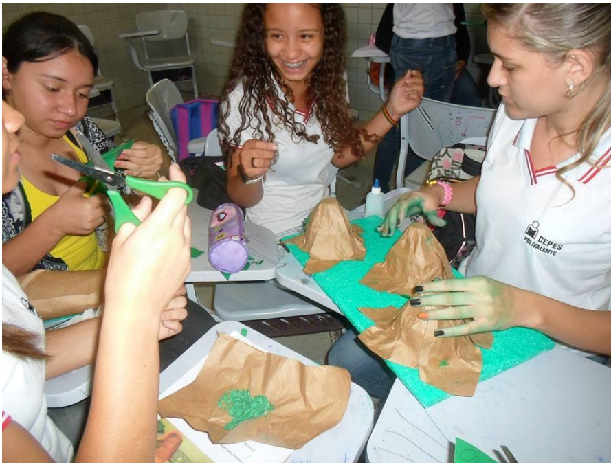
Foto em sala de aula, onde os alunos confeccionam as maquetes.