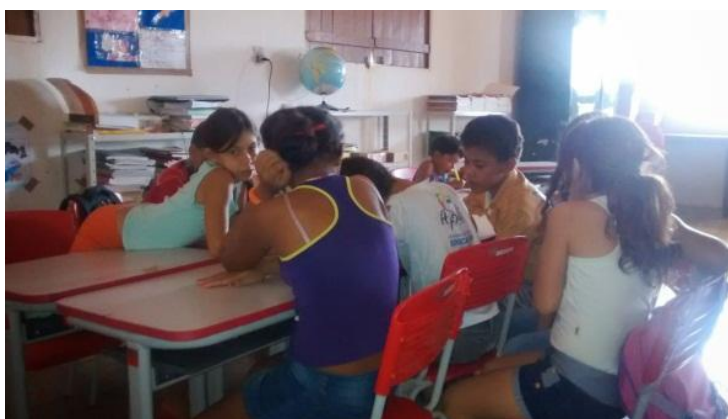
Figura 1; Crianças realizando atividade.

Foi observado ainda que as aulas da professora, embora não dialogasse com o que se espera que seja trabalhado na educação do campo (que conteúdos dialoguem com a realidade local dos/as estudantes), a mesma buscava de alguma maneira fazer uma pequena relação através de exemplos dados durante as explicações do conteúdo. Assim, notamos que os planejamentos das aulas não atendem às especificidades dos povos do campo e tem como base o que se discute nas escolas urbanas.