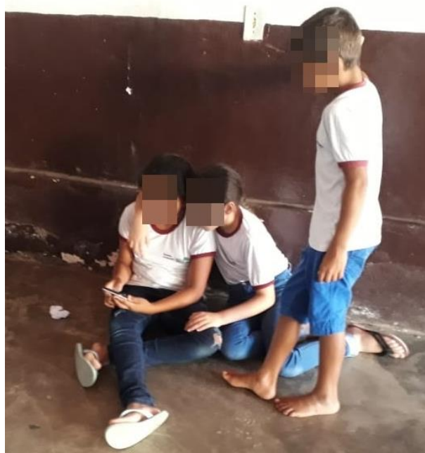
Figura 7 – Crianças aprendendo se divertindo no intervalo.