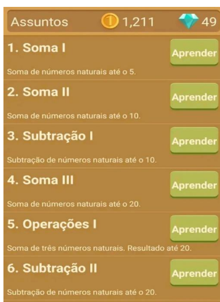
Figura 2 – Variabilidade de conteúdo abordado.

O usuário, além aprender jogando, pode adquirir conhecimento no tópico de assuntos, como pode ser observado na Figura 2. O mesmo é constituído por 97 conteúdos diferentes, que vão desde conteúdos simples, como adição e subtração, a problemas mais complexos, como frações e raízes quadradas.