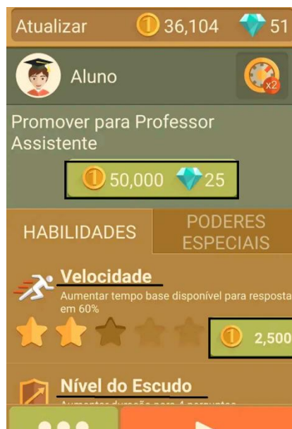
Figura 4 – Desenvolvimento do personagem.