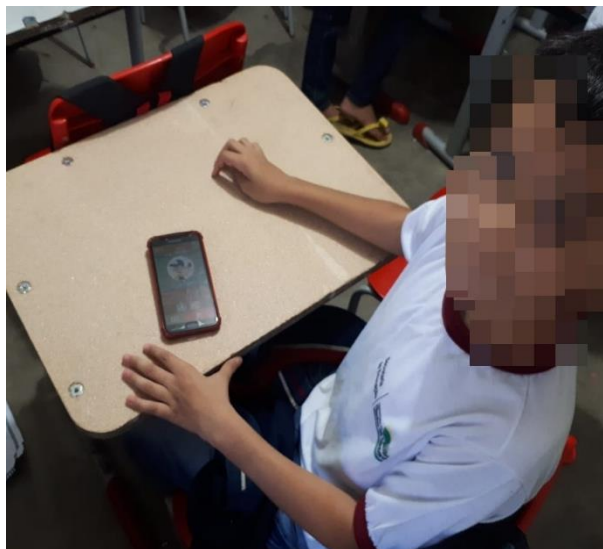
Figura 6 – Criança se divertindo com o aplicativo.

é composto por etapas, onde os jogadores possuem como propósito evoluir o seu avatar, como pode ser observado na Figura 6, onde o usuário já evoluiu o seu avatar de bebê para criança.