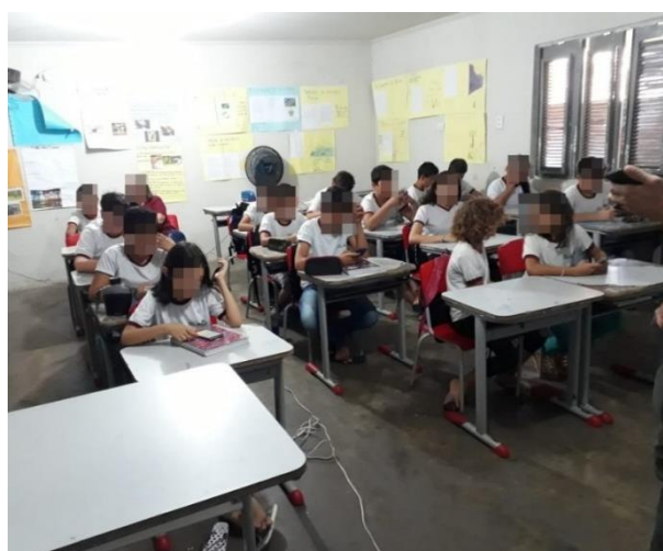
Figura 5 – Aula expositiva e prática.

Inicialmente, com a demonstração do aplicativo, observou-se que tanto os alunos quanto os professores, expressavam interesse no jogo, como pode ser perceptível na Figura 5. Uma vez que o objetivo principal está baseado em facilitar o aprendizado da matemática, combinando o útil com o agradável, de modo que as crianças aprendam se divertindo e não apenas realizando uma atividade corriqueira.