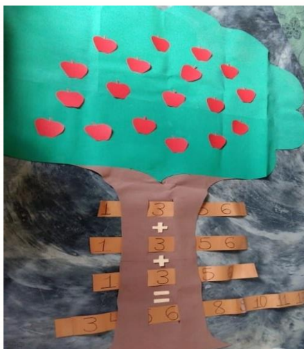
Figura 1. Árvore Aritmética