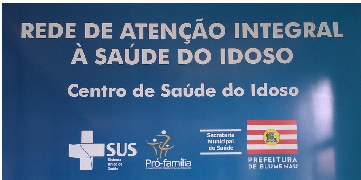
FIGURA 2 – CENTRO DE SAÚDE DO IDOSO

Nesse contexto e com uma visão pautada na política de humanização do SUS observou-se a necessidade de proporcionar um atendimento multiprofissional com foco no idoso fragilizado de Blumenau em 2010. De acordo com o que é orientado pelo Ministério da Saúde, a Secretaria Municipal de Saúde de Blumenau deu início no ano de 2011 à formação da equipe que viria a participar do Centro de Referência de Atenção à Saúde do Idoso, denominada Centro de Saúde do Idoso (CSI) inaugurado em 12 de abril de 2012 (WATANABE et al., 2009; MACIEL, 2017).