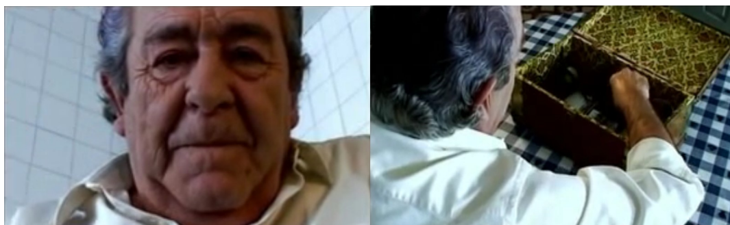
Figura 1: O personagem principal surge através da pequena caixa; um sujeito que se constitui a partir das suas lembranças, sem cair numa nostalgia cética.

O personagem principal, um homem de idade avançada com ares saudosos, aparece sentado de frente para uma caixa na qual guardara objetos e lembranças de um tempo distante. Nesse primeiro momento do curta-metragem, deparamo-nos com um sujeito aparentemente solitário que, vasculhando os espólios da sua juventude, remanesce em soturna nostalgia. Forma-se, aqui, uma imagem bastante associada à velhice – a do indivíduo que não mais vive no presente, mas, que existe apenas para contemplar seu passado.