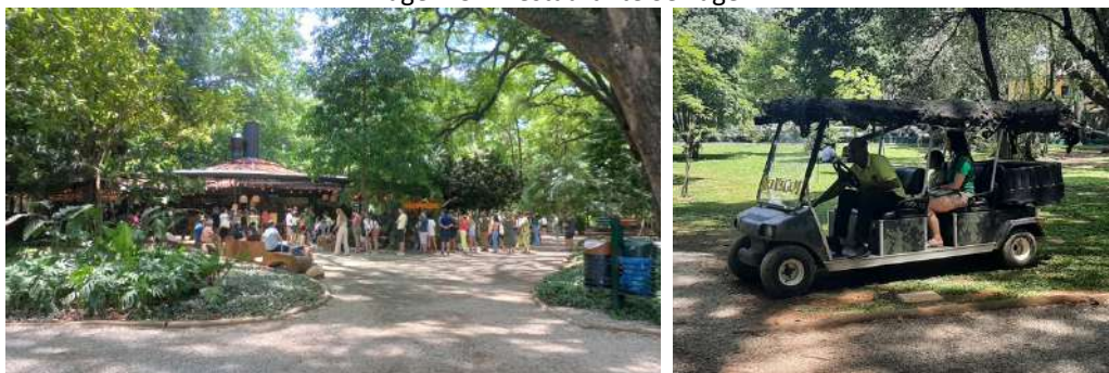
Imagem 3 – Restaurante Selvagem.