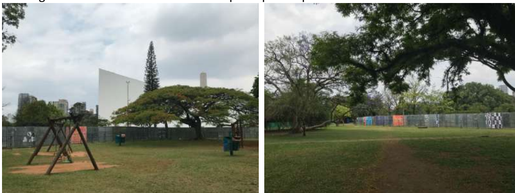
Imagem 2 – Área do auditório cercada por tapumes para o evento iFood Arena Brasileira.

Diante da restrição de que “nenhum tipo de isolamento da área” seria permitido, questiona-se como a delimitação da área com tapumes pôde ser realizada sem que a fiscalização da Prefeitura interferisse na ação da concessionária. A prática de cercamento vem sendo realizada em todos os eventos com público pagante com a justificativa de que é necessário cercar para garantir que o limite de público seja respeitado.