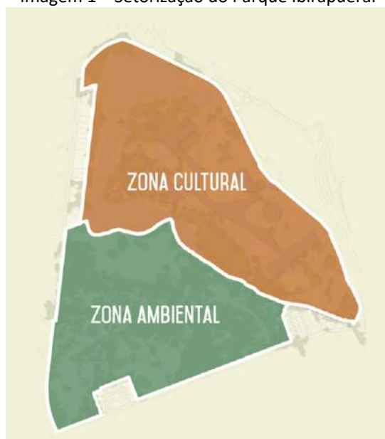
Imagem 1 – Setorização do Parque Ibirapuera.