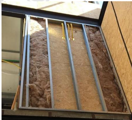
Figura 7 - Uso de lã mineral para isolamento térmico e acústico de paredes LSF

Nas obras analisadas a solução adotada foi a lã mineral associada às placas de gesso e/ou OSB (Figura 7). Conforme relatado pelo engenheiro Paulo Rezende, a escolha destes materiais se dá em função dos ótimos resultados obtidos na proteção térmica e acústica das obras em que foram empregadas.