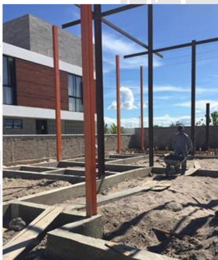
Figura 5 - Solução adotada para fundação com sapatas isoladas e cintamento do baldrame

Desse modo, duas soluções têm sido empregadas nas obras analisadas: laje radier ou fundação direta em sapatas com cintamento do baldrame (Figura 5). A primeira solução destaca-se pela rapidez na execução, uma vez que a própria fundação pode servir como contrapiso, já a segunda garante maior economia de material.