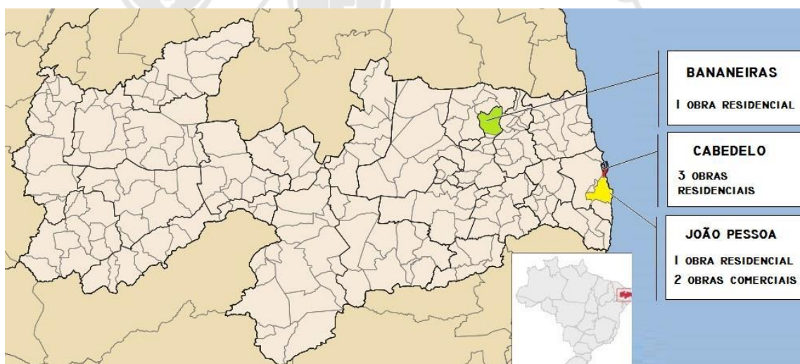
Figura 3 - Mapeamento das obras em LSF no Estado da Paraíba