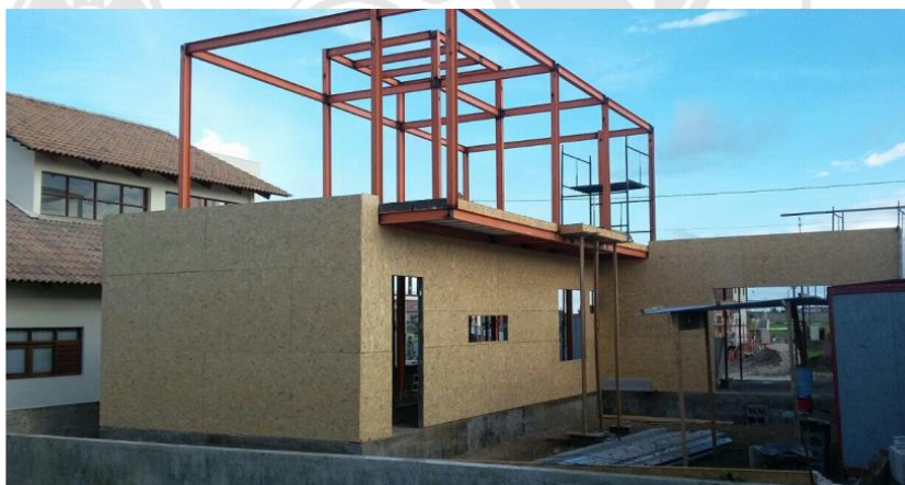
Figura 8 - Paredes externas com revestimento em OSB

O OSB é uma chapa estrutural produzida a partir de partículas de madeira orientadas em três camadas perpendiculares, o que aumenta sua resistência mecânica e rigidez. Nas obras analisadas, as placas de OSB tem espessura comercial de 11,1 mm e são destinadas às paredes externas, preponderantemente, e às internas, somente quando há necessidade de fixação de objetos pesados, tais como televisões, armários, estantes, entre outros.