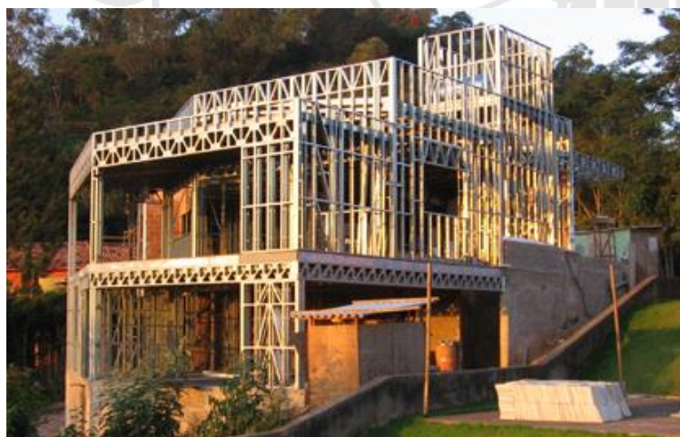
Figura 1 - Sistema estrutural de uma residência em LSF

O LSF é um método construtivo de concepção racional, que tem como característica uma estrutura constituída por perfis formados a frio de aço galvanizado (FREITAS; CRASTO, 2006).