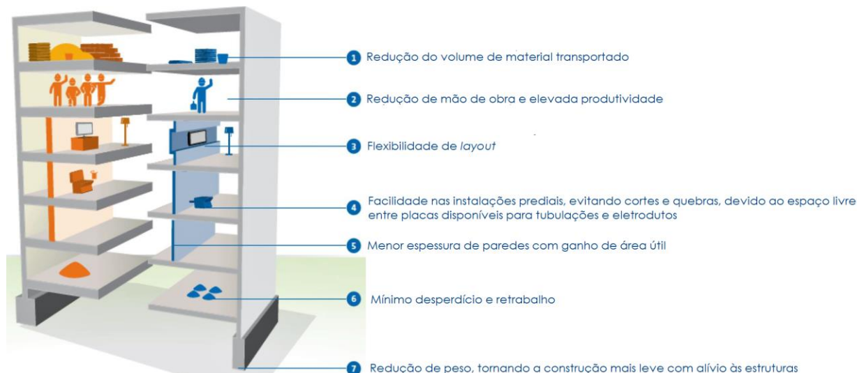
Figura 2 - Esquema comparativo entre a construção convencional e a seco