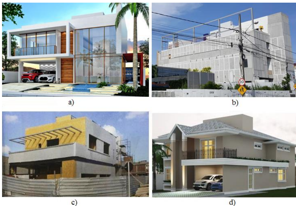
Figura 4 - Obras com Light Steel Frame na Paraíba