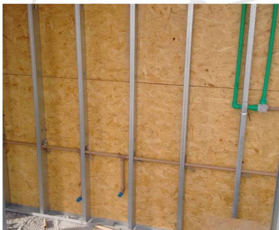
Figura 6 - Instalação de água fria e água quente no interior da parede LSF

Logo após a montagem da estrutura metálica são executadas as instalações elétricas e hidráulicas (Figura 6).